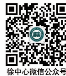
徐中心微信公众号